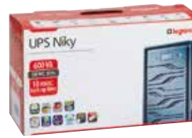
esztétikus és ergonomikus dobozban szállítva

Részleges védelem: túlterhelés, rövidzárlat, rövid és hosszú idejű túlfeszültségek, feszültség ingadozás, alacsony hálózati feszültség valamint áramkimaradás ellen