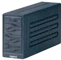
3 100 02