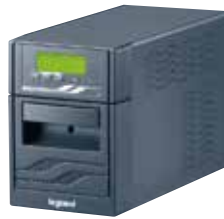
3 100 06