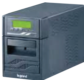
3 100 06

Részleges védelem: túlterhelés, rövidzárlat, rövid és hosszú idejű túlfeszültségek, feszültség ingadozás, alacsony hálózati feszültség, EMI/RFI zavar valamint áramkimaradás ellen